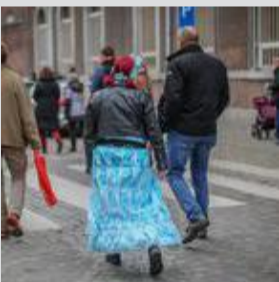
Manifestation de samedi.

Valêt ! Il faut que je te raconte ce que j'ai vu lors de la manifestation contre le CST de ce samedi dans les rues de la Cité ardente ! Une manifestante avait mis du cœur à l'ouvrage et avait créé une robe de ses propres mains avec... des masques ! Autant te dire que Nanesse était fan ! D'autant plus qu'à Liège on ne fait rien les choses à moitié ! Elle avait même fait une belle couronne en pliant des masques en forme de fleurs. En voilà une idée pour une soirée déguisée !