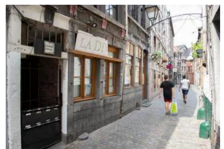
LWS Une ado séquestrée en Roture à Liège.