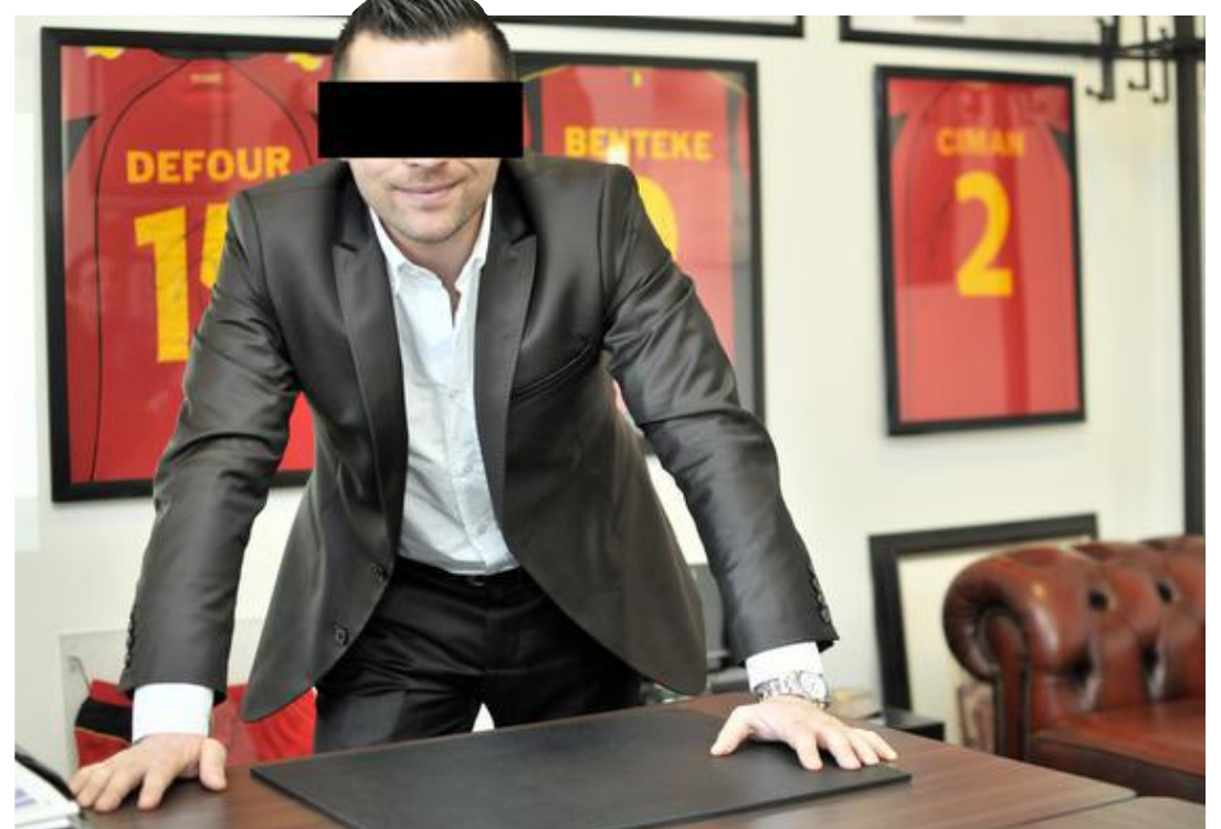
Le secrétaire des stars, la star des secrétaires.

Probablement pour brouiller les pistes, l'homme utilisait, pour ses services, une identité diffé-