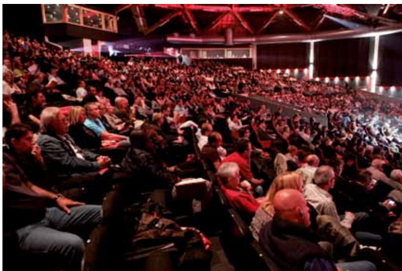
📍 Congrès statutaire de la FGTB, juin 2010. (FGTB, Bruxelles)