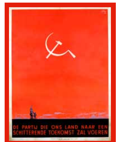
Affiche électorale du Parti Communiste de Belgique, élections législatives de 1946. (Dacob, Bruxelles)