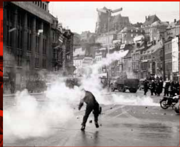
📍 Sérieux affrontements dans la Cité ardente après un meeting avec André Renard, Place Saint-Paul. Liège, 6 janvier 1961. Assaut contre la gare des Guillemins, les locaux du journal La Meuse , le siège de l'Union des Classes Moyennes ...