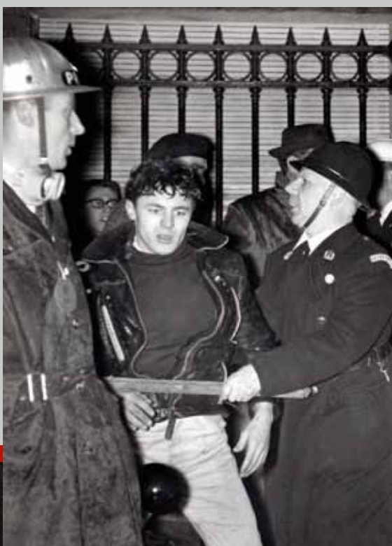
☞ Les forces de l'ordre maîtrisent un gréviste. Bruxelles, 4 janvier 1961.

La grève connaît un premier fléchissement entre le 3 et le 5 janvier 1961, avec les premières reprises de travail en Flandre et à Bruxelles. La Wallonie résiste, mais la grève prend une tournure de plus en plus tendue, comme en témoignent les actes de sabotage et les combats de rue en région liégeoise. Le 6 janvier, une concentration de masse a lieu Place Saint-Paul à Liège. L'assaut contre la gare des Guillemins et la confrontation avec les forces de l'ordre coûte la vie à deux manifestants. Le week-end du 7 et du 8 janvier est caractérisé par des actions de sabotage dans le Hainaut et la province de Liège. La position du gouvernement et celle des grévistes sont, plus que jamais, diamétralement opposées. Les jours qui suivent ce week-end, sont marqués par une reprise du travail en Wallonie aussi. Au total quatre personnes ont trouvé la mort pendant la grève.