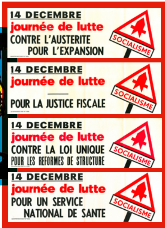
Tract de la FGTB contre la Loi unique, édité dans le cadre de l'Opération Vérité.