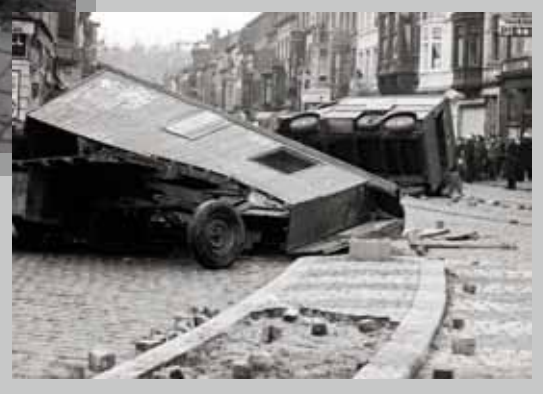
📍 Des grévistes retournent deux camions et détachent des pavés, sans doute pour les lancer contre la police. Liège, rue des Guillemins, 6 janvier 1961.