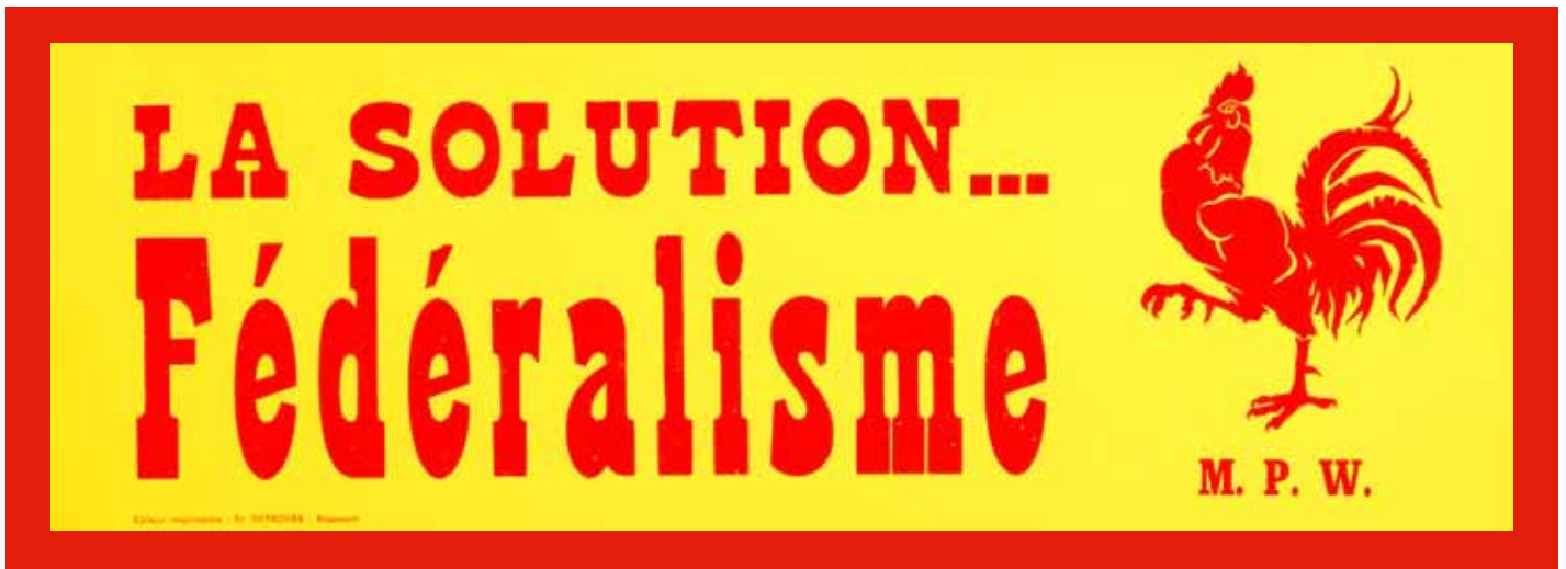
📍 Affiche du Mouvement Populaire Wallon en faveur du fédéralisme.