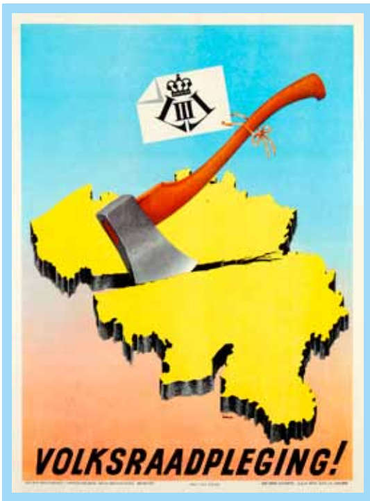
☐ Affiche mettant en garde contre l'éventuel retour du Roi Léopold III sur le trône après le référendum du 12 mars 1950.

Après la guerre, la Question royale divise le pays en un camp philosophique de gauche et un camp catholique. Les communistes, les libéraux et les socialistes s'opposent au retour sur le trône de Léopold III parce qu'en mai 1940, il n'avait pas suivi le gouvernement en exil à Londres. Ils condamnent aussi la ligne politique qu'il a suivie avec entêtement pendant l'occupation, sa préférence pour un pouvoir exécutif fort et la visite qu'il a rendue à Hitler. Le 12 mars 1950, un référendum est organisé. En Flandre, une large majorité vote en faveur du retour de Léopold III, la Wallonie et Bruxelles votent massivement contre. Finalement, plus de la moitié des Belges se prononcent en faveur du retour. Lors des élections législatives organisées plus tard dans l'année, le CVP-PSC obtient la majorité absolue. Rien ne s'oppose plus au retour de Léopold III, à l'exception de la FGTB. Le syndicat socialiste déclenche une grève dans les bassins industriels en Wallonie. Les affrontements avec les forces de l'ordre à Grâce-Berleur font plusieurs morts. Les grévistes menacent même de proclamer une république wallonne. Mais la grève s'étend à la Flandre. Comme la situation risque de devenir prérévolutionnaire, Léopold III abdique. Baudouin lui succède. Durant les années 50, la question scolaire opposera également laïcs et catholiques.