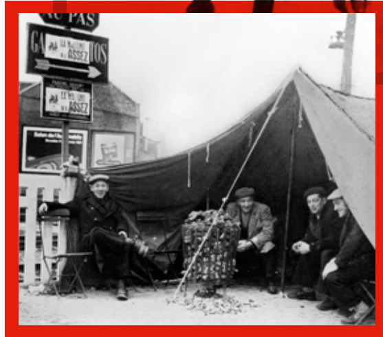
📍 Mécontentement des grévistes et touche fédéraliste. Piquet de grève à Haine-Saint-Pierre, 2 janvier 1961.