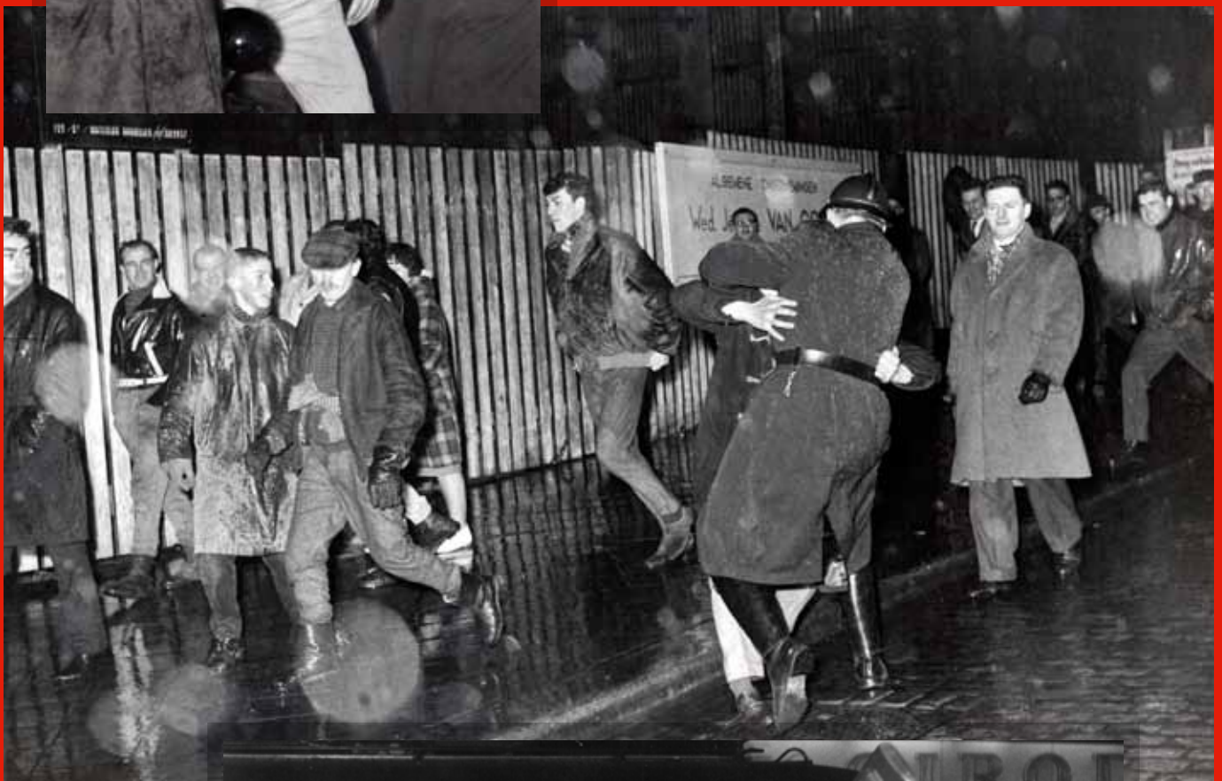
☞ Charge de la gendarmerie à coups de crosse. (Institut Emile Vandervelde, Bruxelles)