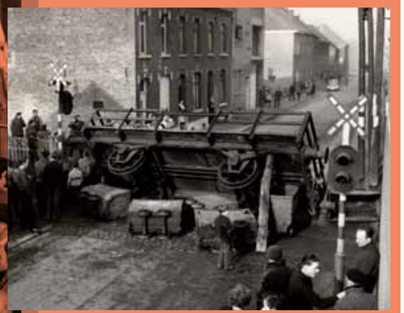
☐ Grève des mineurs, 1959. A l'aide d'un wagon de marchandises renversé, les grévistes tentent de perturber le trafic à Pâturages.