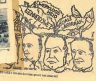
Collage de journaux et hebdomadaires socialistes parus pendant la grève dans le but d'informer la base des événements.