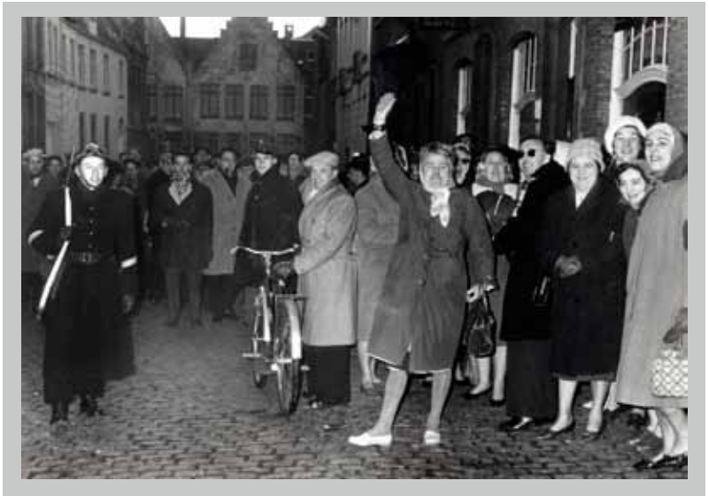
La grève à Bruges, fin décembre 1960.

Après un démarrage rapide, la grève s'étend lentement mais sûrement à la Flandre et à Bruxelles. En Wallonie – tout comme à Bruxelles – elle est accompagnée, à partir du 27 décembre 1960, de concentrations de masse dans les principales villes. A cette même date, le Comité national de la Confédération des Syndicats Chrétiens (la CSC) prend la décision définitive de ne pas participer au mouvement. Le lendemain, à l'occasion d'une importante manifestation qui se déroule à Gand, les premiers heurts violents entre grévistes et forces de l'ordre se produisent. Ensuite, de plus en plus de régionales flamandes de la FGVB rejoignent le mouvement de grève qui atteint son point fort le 30 décembre, avec un nombre de grévistes record.