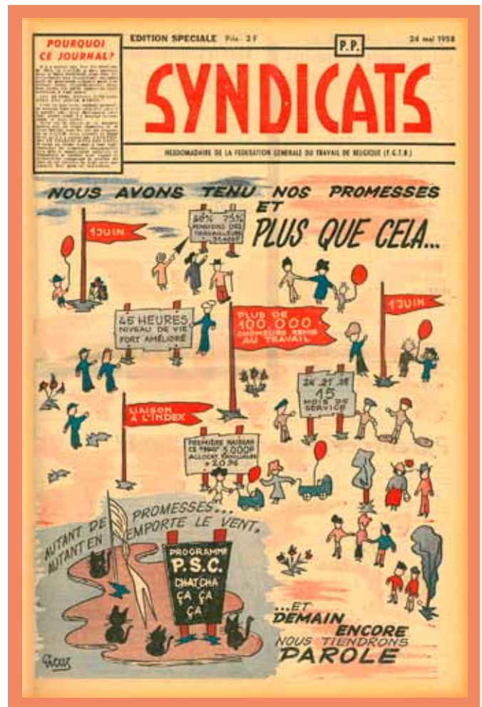
① L'hebdomadaire de la FGTB Syndicats souscrit au programme électoral du Parti Socialiste Belge, élections législatives, 1958. (Amsab-IHS, Gand)

⇒ Le projet de Loi unique, déposé début novembre 1960 par le gouvernement Eyskens-Lilar. (Amsab-IHS, Gand)