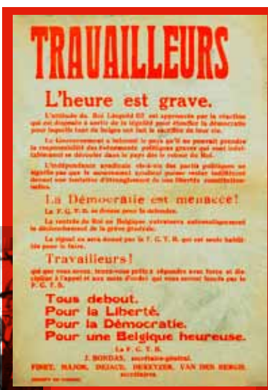
☐ Affiche de la FGTB annonçant une grève générale contre l'éventuel retour de Léopold III.