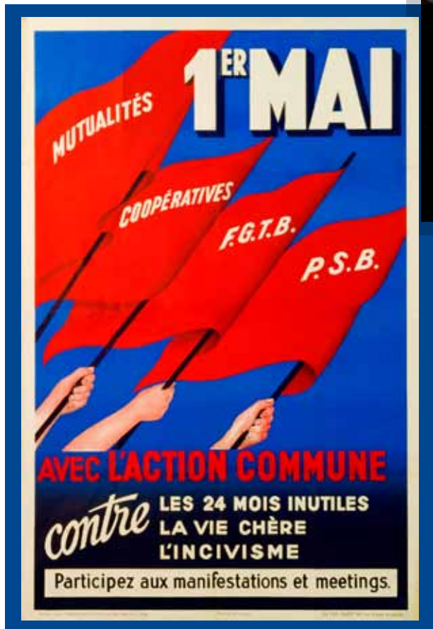
Premier Mai, affiche de l'Action Commune Socialiste contre les 24 mois de service militaire, la vie chère, l'incivisme. Début des années 50.