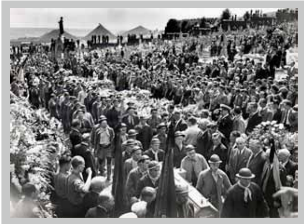
☐ Funérailles des victimes de Grâce-Berleur, 2 août 1950.