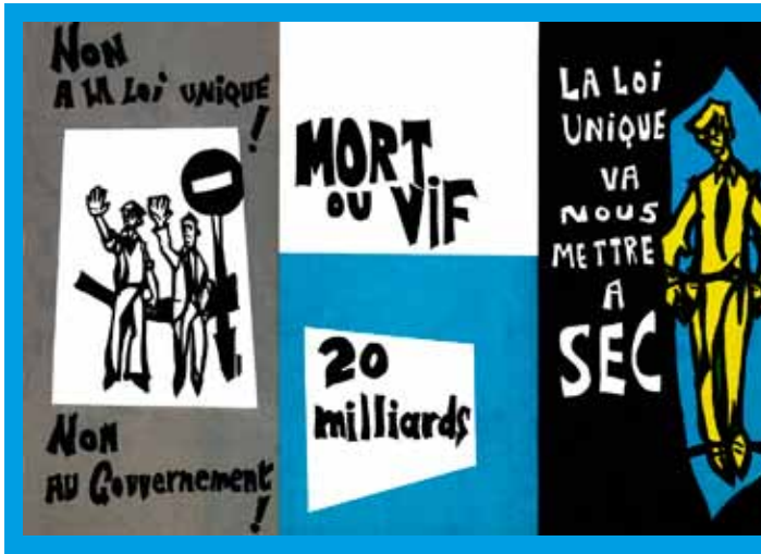
Tract de la régionale FGTB d'Anvers contre la Loi unique, édité dans le cadre de l'Opération Vérité.