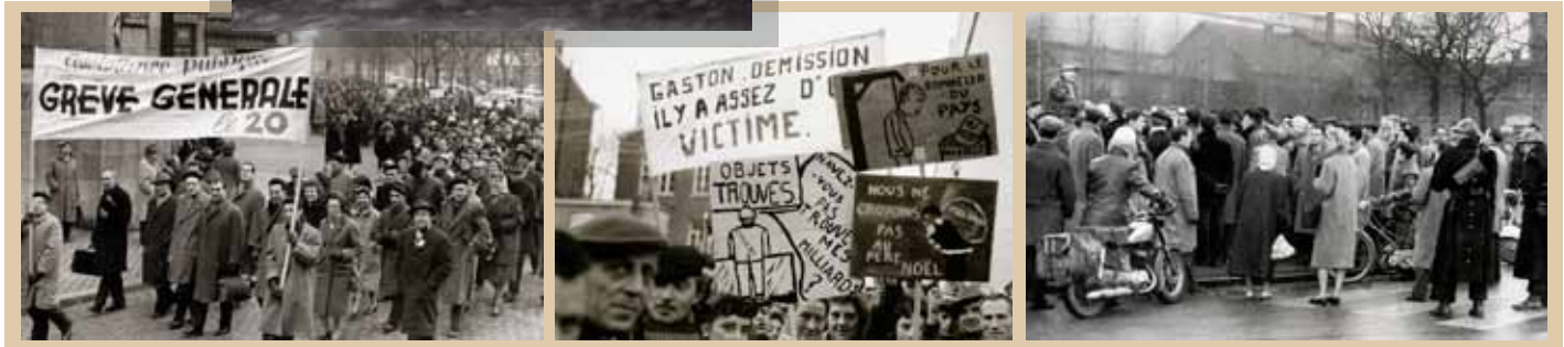
📍 Meeting des grévistes devant la gare de Charleroi, sous l'oeil attentif de la police, 22 décembre 1960.