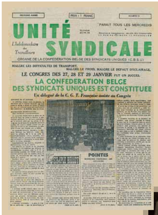
Unité Syndicale, l'organe de la Confédération Belge des Syndicats Uniques proche du Parti Communiste de Belgique.