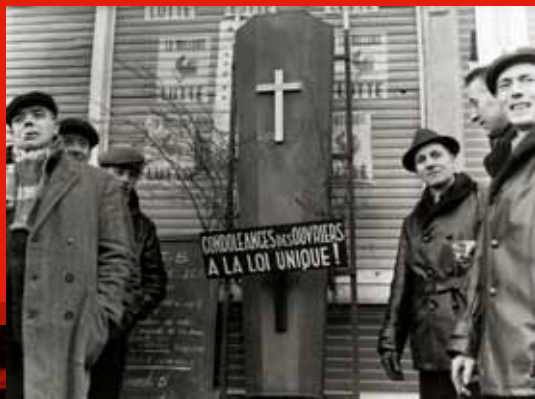
➡ Funérailles symboliques de la Loi unique. Liège, 6 janvier 1961.