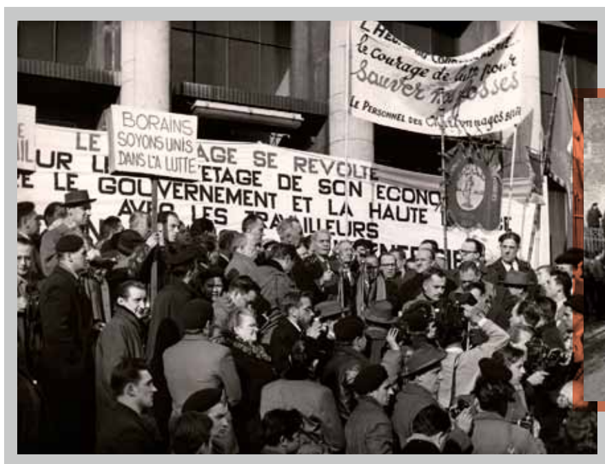
☐ Achille Delattre, Ministre d'Etat, s'adresse aux grévistes. Quaregnon, 16 décembre 1959.