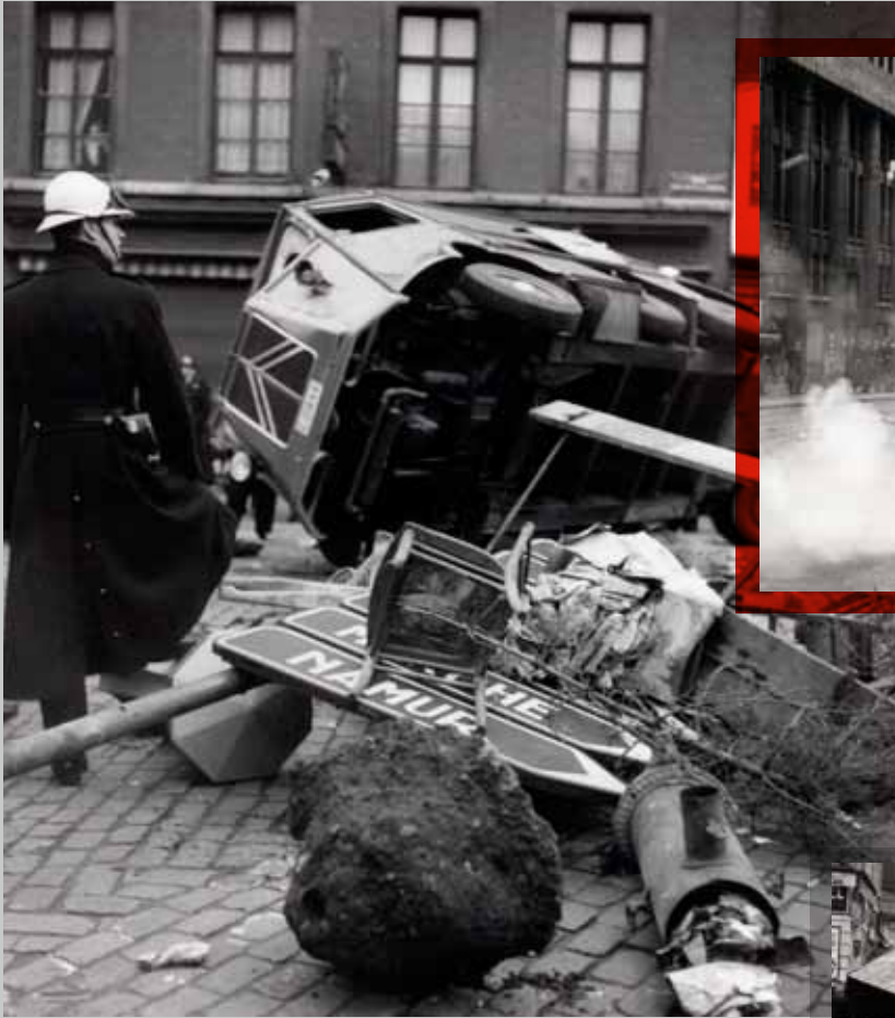
📍 Dégâts causés par des grévistes. Liège, 6 janvier 1961.