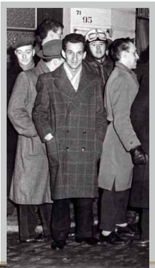
📍 La CGSP de Liège, en grève dès le premier jour, appelle déjà le 14 décembre 1960 à faire grève six jours plus tard.